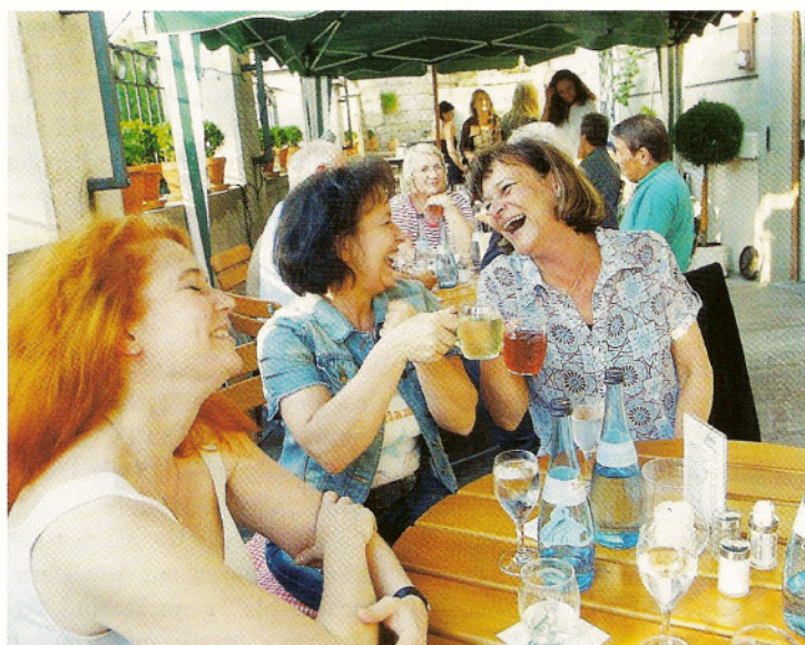
Amalfi kann so nah sein – zum Beispiel im Besen 66 an der Weinsteige